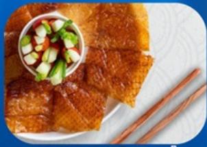
พิเศษ!! เมนูเปิดปักกิ่ง