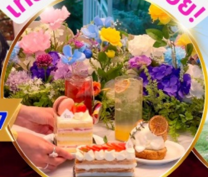
คาเฟ่ดัง Forest Outing