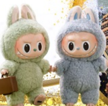
ห้องสมุด Starfield