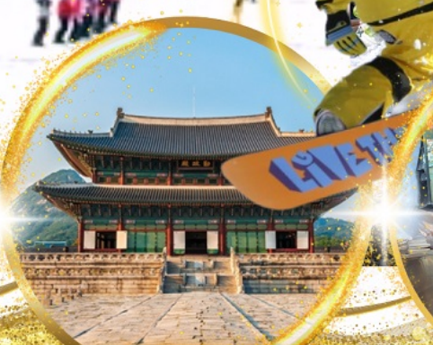
พระราชวังเคียงบกกุง