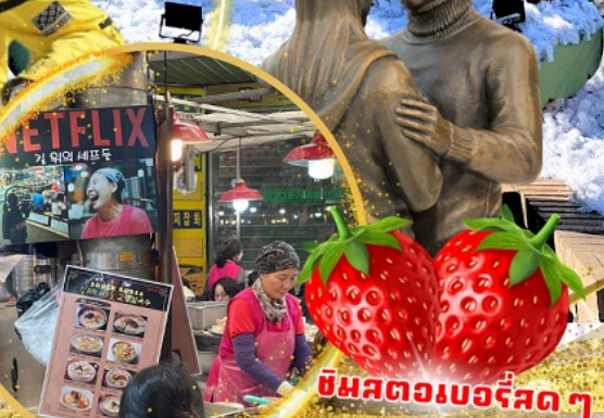
ตลาดกวางจง