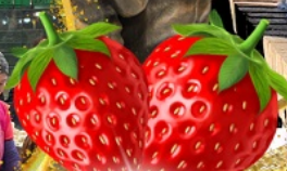
มีผลตอบเบอจึ่สด ๆ จากรั้ว