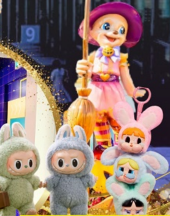
ชาว Art toy ห้าพลาด ตามล่าหา Labubu กับ PPG ที่โซล