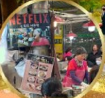
สตรีทฟู้ดตลาดกวางจิง