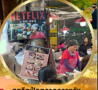
สตรีทฟู้ดตลาดกวางจ้ง