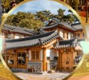
หมู่บ้านโบราณอินพยอง