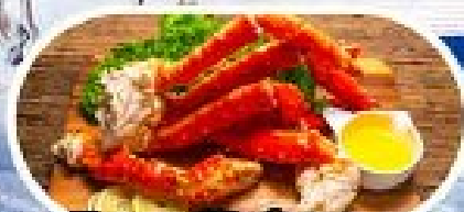
เมนูพิเศษซาปูยักษ์ KING CRAB