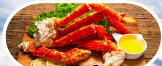
เมนูพิเศษซาปูยักซ์ KING CRAB