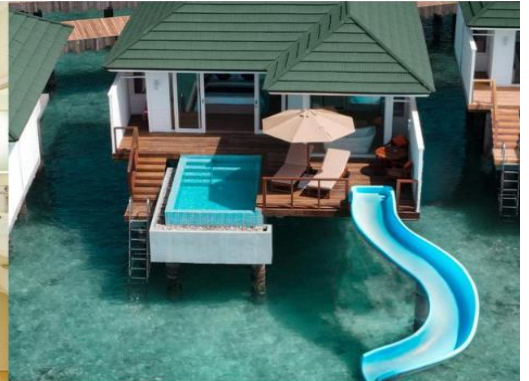
WATER VILLA WITH POOL + SLIDE