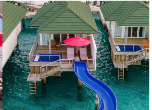
OCEAN VILLA WITH POOL + SLIDE