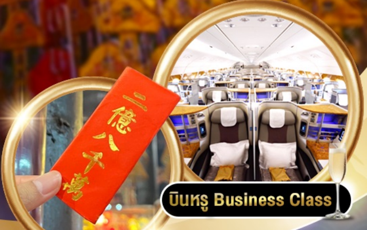
บินหรู Business Class