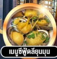
เมมูซี่ฟู้ดลี่ยูนบุ