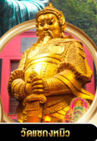
วัดแชกงหมิว