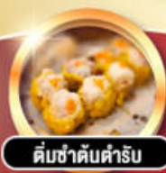
ติ่มซำคันทาร์รับ