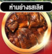
हांอย่างรสเลิศ