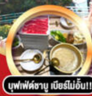
บุฟเฟ่ต์ชาบู เมื่อบริไม้อัน!!