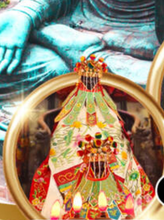
ยืมเงินเจ้าแม่กวนอิมสองห้า