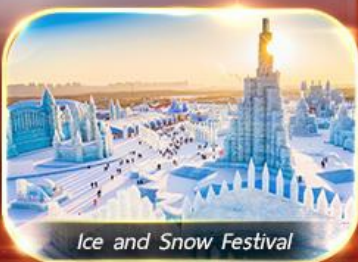
Ice and Snow Festival