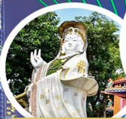
เจ้าแม่กวนอิม รัฟลส์ เบย์