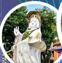
เจ้าแม่กวนอิม ธิพัลส์ เบย์