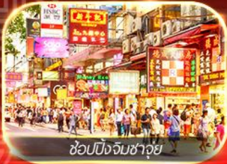
ช้อปปิ้งจิมซาจุ้ย