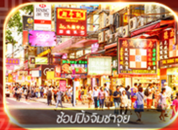
ช้อปปิ้งจิมซาจุ่ย