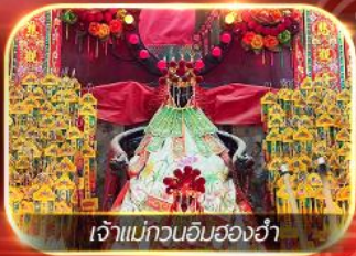
เจ้าแม่กวนอิมฮ่องกง