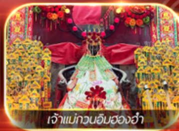
เจ้าแม่กวนอิมสองอ้า