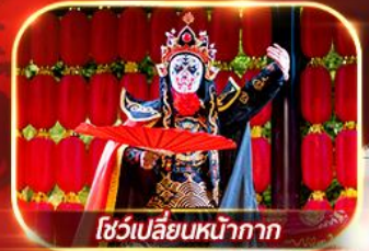
โชว์เปลี่ยนหน้ากาก

สัมผัสความงามไม้เปลี่ยนสีที่จิวจ้ายโกว เยือนเขาจ้อไบ๊ ชมอุทยานแห่งชาติหวงหลง ล่องเรือชมหลวงพ่อดโตเล่อซาน