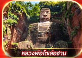
หลวงพ่อดโตเล่อซาน