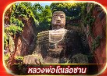
หลวงพ่โตเล่อซาน