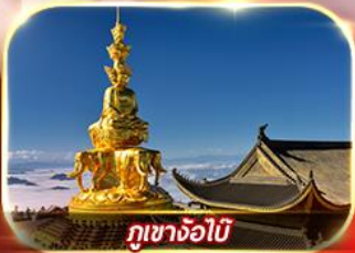
ภูเขาจ้อไบ๊