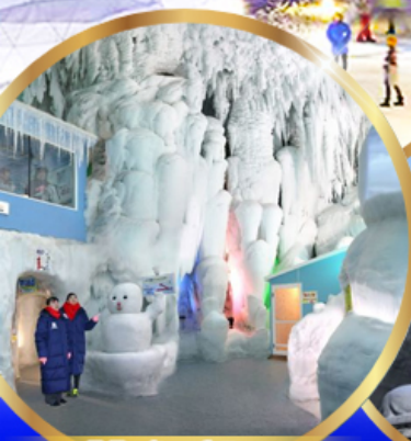
พิพิธภัณฑ์ หิมะ และน้ำแข็ง คามิกาวะ