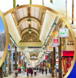
ช้อปปิ้ง ทานุกิโศจิ

ราคา เริ่มต้น 58,919 บาท รวมภาษีมูลค่าเพิ่ม 7%