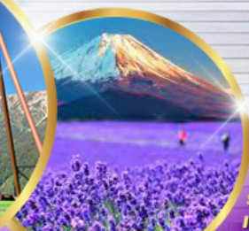
โออิชิ ปาร์ค