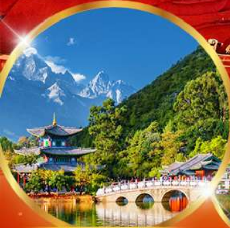
สระมิงกรต้า