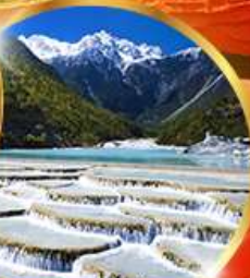
หุบเขาพระจันทร์ สีน้ำเงิน