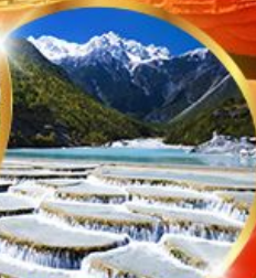
หุบเขาพระจันทร์ สีน้ำเงิน