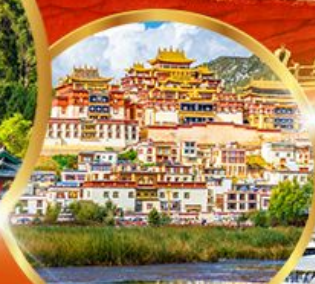
วัดชงจันหลิน