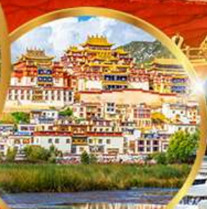
วัดชงจ้านหลิน