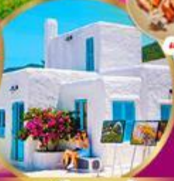
มารีนา คาเฟ่