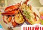
เมนูพิเศษ! "ทุ่งลือบสเตอร์"