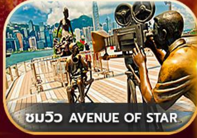
ชมวิว AVENUE OF STAR