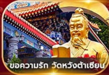
ขอความรัก วัดหวังต้าเซียน