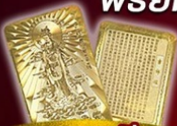
แถมฟรี แผ่นทองเจ้าแม่กวนอิม