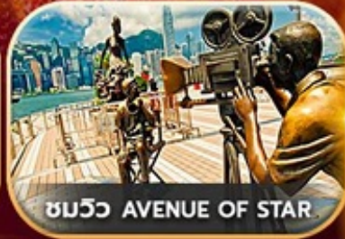
ชมวิว AVENUE OF STAR