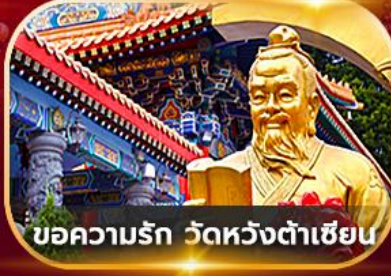
บ่อความรัก วัดหวังต้าเซียน