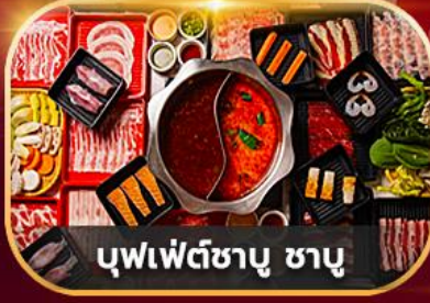
บุฟเฟ่ต์ซาบู ซาบู