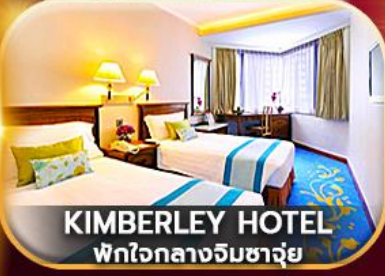
KIMBERLEY HOTEL พักใจกลางจิมซาจ่ย