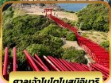
ศาลเจ้าโมโตโนสุมิอินาริ