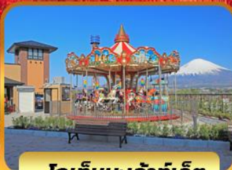
โกเท็มบะเจ้าท์เล็ด