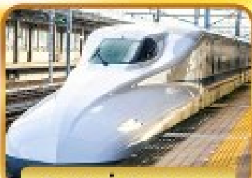
สัมผัสนั่งชินกันเซน