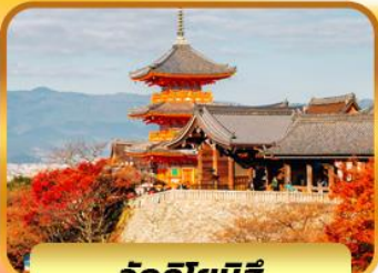
วัดคิโยมิจิ