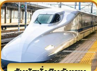
สัมผัสนั่งชินกันเซน