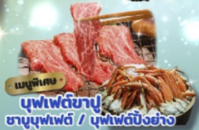
เมนูพิเศษ บุฟเฟ่ต์ข้าว ชาบูบุฟเฟ่ต์ / บุฟเฟ่ต์บิงย่าง

วันเดินทาง 18-24 พ.ย.2567 1-7 ธ.ค.2567 6-12 ธ.ค.2567