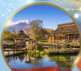
หมู่บ้านโอชิโนะอักษิโก