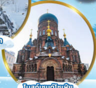
โบสถ์เซนต์โซเฟีย