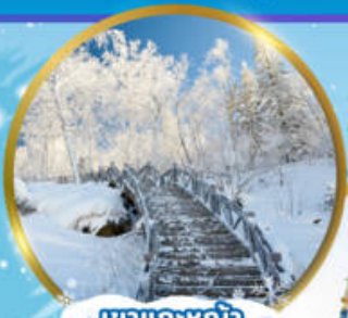
เขาแกะหิมะ