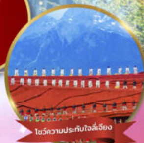
โชว์ความประทับใจลี่เจียง