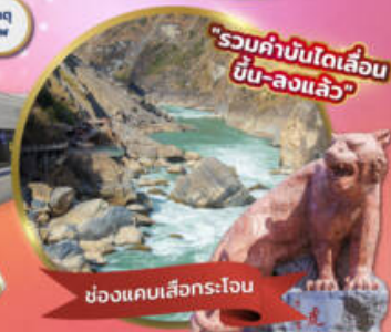
"รวมค่าบินได้เลื่อน ขึ้น-ลงแล้ว"