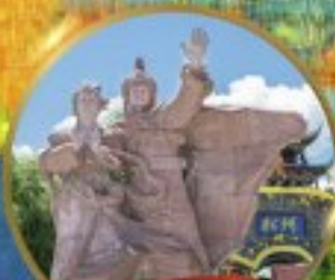
เมืองโบราณชงฟาน