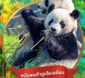
หมีแพนด้าเจียงเยียน