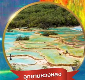
อุทยานหองหลง