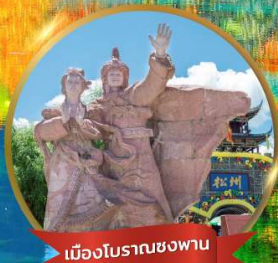
เมืองโบราณชงฟาน