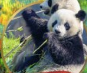
หิมะแพนด้ายักษ์เมืองเหมิน