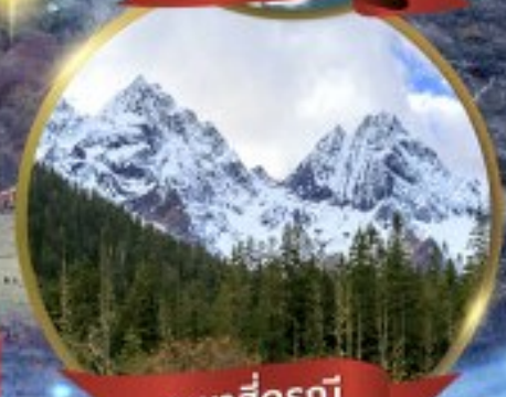
ภูเขาสี่ฤดู