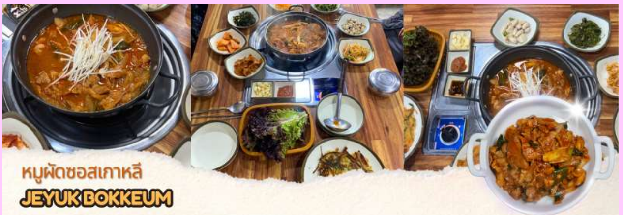
หมูผัดซอสเกาหลี JEYUK BOKKEUM