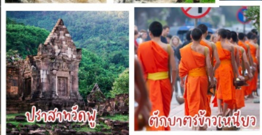
ปราสาทวัดพู