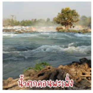
น้ำตกคอนพะเพ็ง