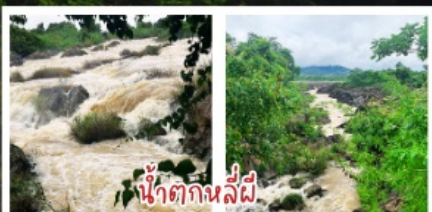
น้ำตกกลีผี