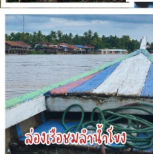
ล่องเรือชมลำน้ำโขง