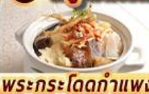
พระกระโดดกำแพง