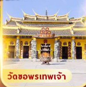
วัดขอพรเทพเจ้า