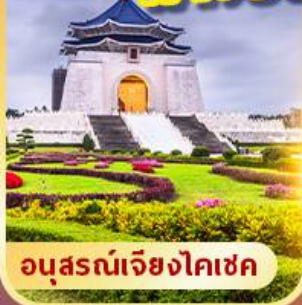
อนุสรณ์เจียงไคเชค