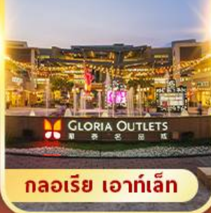
กลอเรีย เอาท์เล็ต