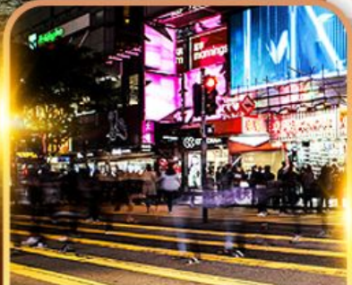
ซ้อปบั้ง Tsim Sha Tsui