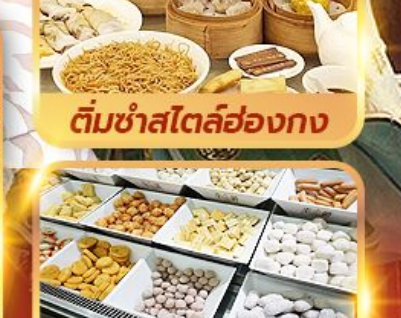
ติ่มซำสไตล์ฮ่องกง