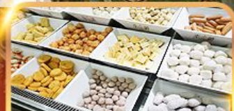
ชาบูบุฟเฟ่ต์