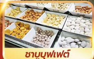
ชาบูบุฟเฟ่ต์