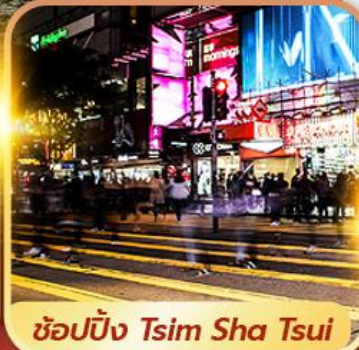
ซ็อบปิ้ง Tsim Sha Tsui