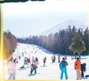
ลานสกีฟูจิเท็น