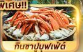
กินซาปูบุฟเฟ่ต์