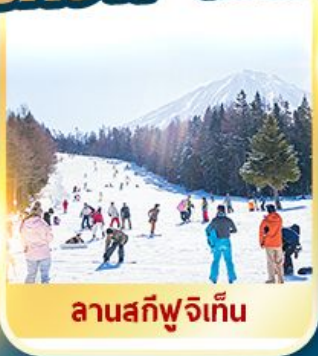
ลานสกีฟูจิเท็น