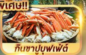
กินชาบูบุฟเฟ่ต์