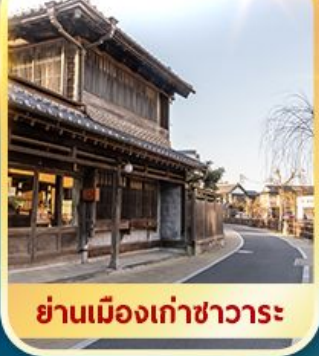
ย่านเมืองเก่าซาวาระ