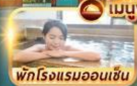
พักโรงแรมออนเซ็น