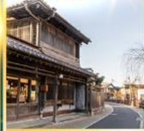
ย่านเมืองเก่าซาวาระ