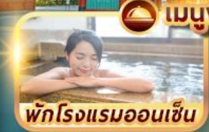
พักโรงแรมออนเซ็น