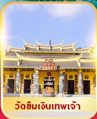
วัดยิมเงินเทพเจ้า