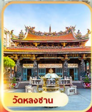
วัดหลงซาน