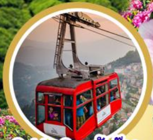
Cable Car กิ่งตอก