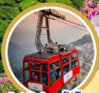
Cable Car ถึงต้อก