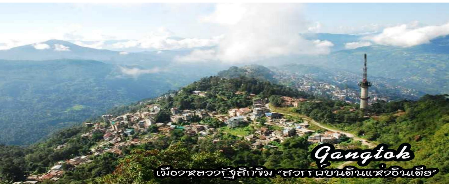
Gangtok เมืองหลวงรัฐสิกขิม “สวรรค์บนดินแห่งอินเดีย”

08.00 น. นำท่านออกเดินทางสู่ เมืองดาร์จีลิง - เมืองกันต็อก (Gangtok) ระยะทาง 96 ก.ม. ใช้เวลาเดินทางประมาณ 4-5 ชั่วโมง(ขึ้นอยู่กับจราจร) “เมืองกันต็อก” (Gangtok) เมืองหลวงแห่งรัฐสิกขิม “รัฐสิกขิม” (Sikkim) เมืองสายหมอก เป็นรัฐทางตอนเหนือของประเทศอินเดีย มีภูมิประเทศแบบที่ราบสูงบนเทือกเขาหิมาลัย มีพรมแดนติดกับหลายประเทศ อาทิ เขตปกครองตนเองทิเบต, เนปาล และภูฏาน แต่เดิมสิกขิมเป็นรัฐเอกราช มีขนาดใหญ่กว่ากรุงเดลี เมืองหลวงของอินเดียเล็กน้อย ปกครองโดยราชวงศ์นัมเยล ด้วยความเป็นรัฐเอกราชเล็กๆ อาจถูก