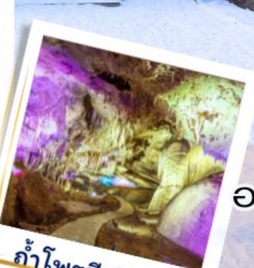
ถ้ำไฟรมีเทียส