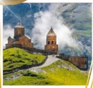
โบสถ์เกอร์เกติ