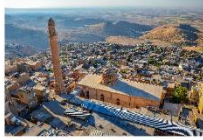
เมืองมาร์ดิน