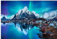
หมู่เกาะโลโฟเทน

00.00 น. ออกเดินทางสู่ เมืองเลกเนส โดยสายการบิน Scandinavian Airlines เที่ยวบินที่ SK 4106 แวะเปลี่ยนเครื่องที่เมือง Bodo เป็นสายการบิน Wide roe WF 810 00.00 น. เดินทางถึงสนามบินเมืองเลกเนส