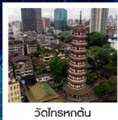
วัดไทรหัดตัน

ทัวร์คุณภาพ ไม่ลงร้านช้อปปิ้ง ไม่ขายออฟชั่น