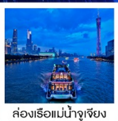
ล่องเรือแม่น้ำจูเจียง

ล่องเรือแม่น้ำจูเจียง / ช้อปปิ้งถนนปักกิ่ง / ช้อปปิ้งถนนซังเซี่ยจิว / วัดไทรหัดตัน / ศาลเจ้าตระกูลเฉิน / ถนนคนเดินหย่งซังฟาง