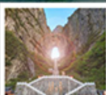
เขากิ๋นหมินซาน