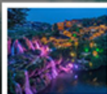
ฟูรงเจิน