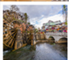
เมืองโบริธานลี้เจียง