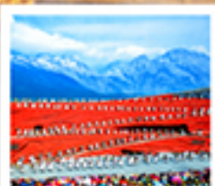
ไร่จรงอวี่ใหม่