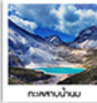
ทะเลสาบน้ำนม