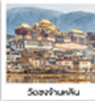
วัดซงจ้านหลิน