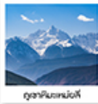
อุทยานเทม่งซี