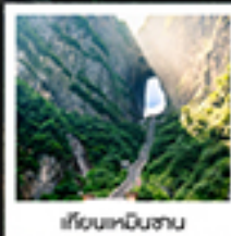
เขานาฬิกาหิน

แอร์ไลน์คอม / สพานกัวฟู่กวง / เขานาฬิกาหิน / เมืองฝ่งหวง / ประตูสวรรค์ / ไร่หวงจิงจิงอวตาร / เขานาฬิกาหิน สวนจอนหวง / ภาพวาดทราย / เมืองฟูหลงเจิน / ล่องเรือตามลำน้ำต๋อเจียง / เขามือโบราณฝ่งหวงยกทำหิน