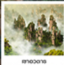
เขาอวตาร