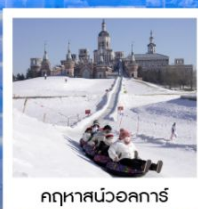
ฤดูหสนวอลการ