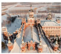
คฤหาสน์บอลการ