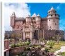
บ้านฮิลล์

แพ็คเกจส่วนตัว 7 - 9 ท่าน **ราคานี้ไม่รวมตัวเครื่องบิน**