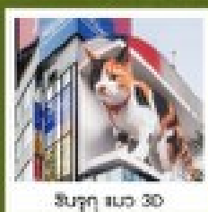
ชินจูกุ วิว 3D

คัมภีร์เมนูคุณพิเศษ บุฟเฟ่ต์ฮาลาลไม่อั้น