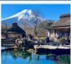
โอฮิโนะ ฮัทโท