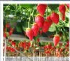
สวนผลไม้ฮามานิตสึ