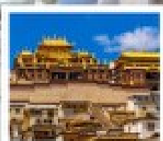
วัดถานะจงฟ่านตึง