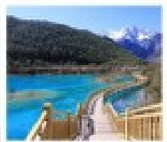
น้ำพุร้อน