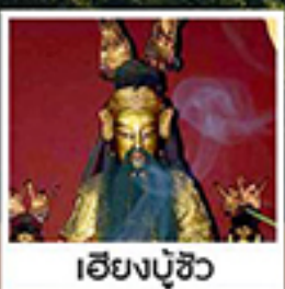
เอียงบู๊ซิว