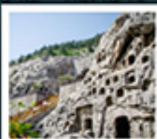
ถ้ำหินหลงเหมิน