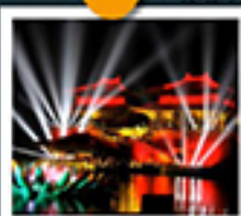
สวนชิงหิงซ่างเหอหยวน