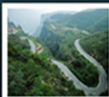
ไท่หิงซาน

หอซุนฮิว / ห้างสรรพสินค้าฟ้างวงหลาย เมืองโกเมิ่ง / สวนชิงหิงซ่างเหอหยวน โชว์ราชวงศ์ซ่ง / แกรนด์เทมพลไท่หิงซาน หมู่บ้านดอกท้อ / ถนนลอยฟ้า หมู่บ้านทิวทัศน์ / 500 กำแพง ถ้ำหินหลงเหมิน / เมืองโบราณก๊วงอี่ โชว์การแสดงวิทยาศาสตร์ล้ำสมัย